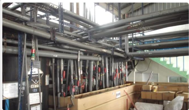
永續：製程用水減量及再利用