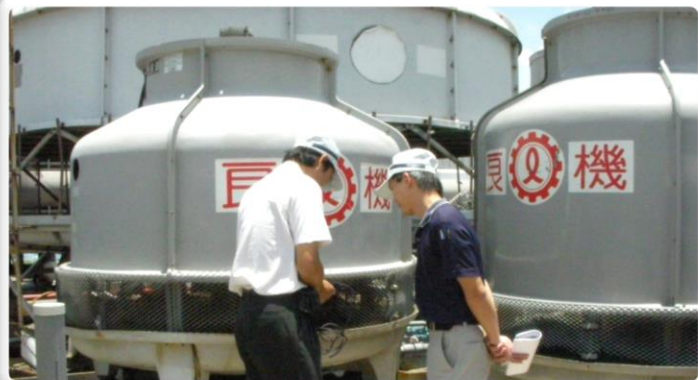
前端：製程及空調節水