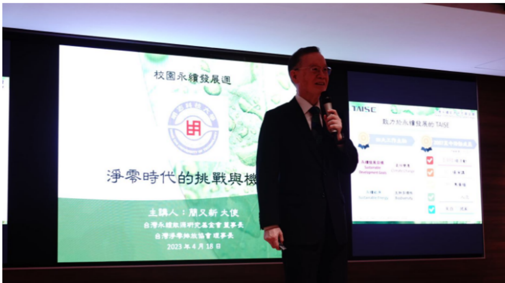
台灣永續能源研究基金會董事長簡又新大使以「淨零時代的挑戰與機會」明志科大師生進行專題演講。

明志科大校園永續週系列，舉辦綠色大學研習會、校園植樹、魚菜共生「黑水虻專題」體驗、環保手工皂DIY等各式豐富活動，內容對應永續發展目標SDGs6淨水及衛生、SDGs12責任消費及生產、SDGs15保育陸域生態，藉由活動冀望透過交流匯聚、經驗分享，齊聚校內外關切永續發展之師生、校友及社區居民，凝聚力量為校園環境永續提昇助益，進一步擴大學校影響力。